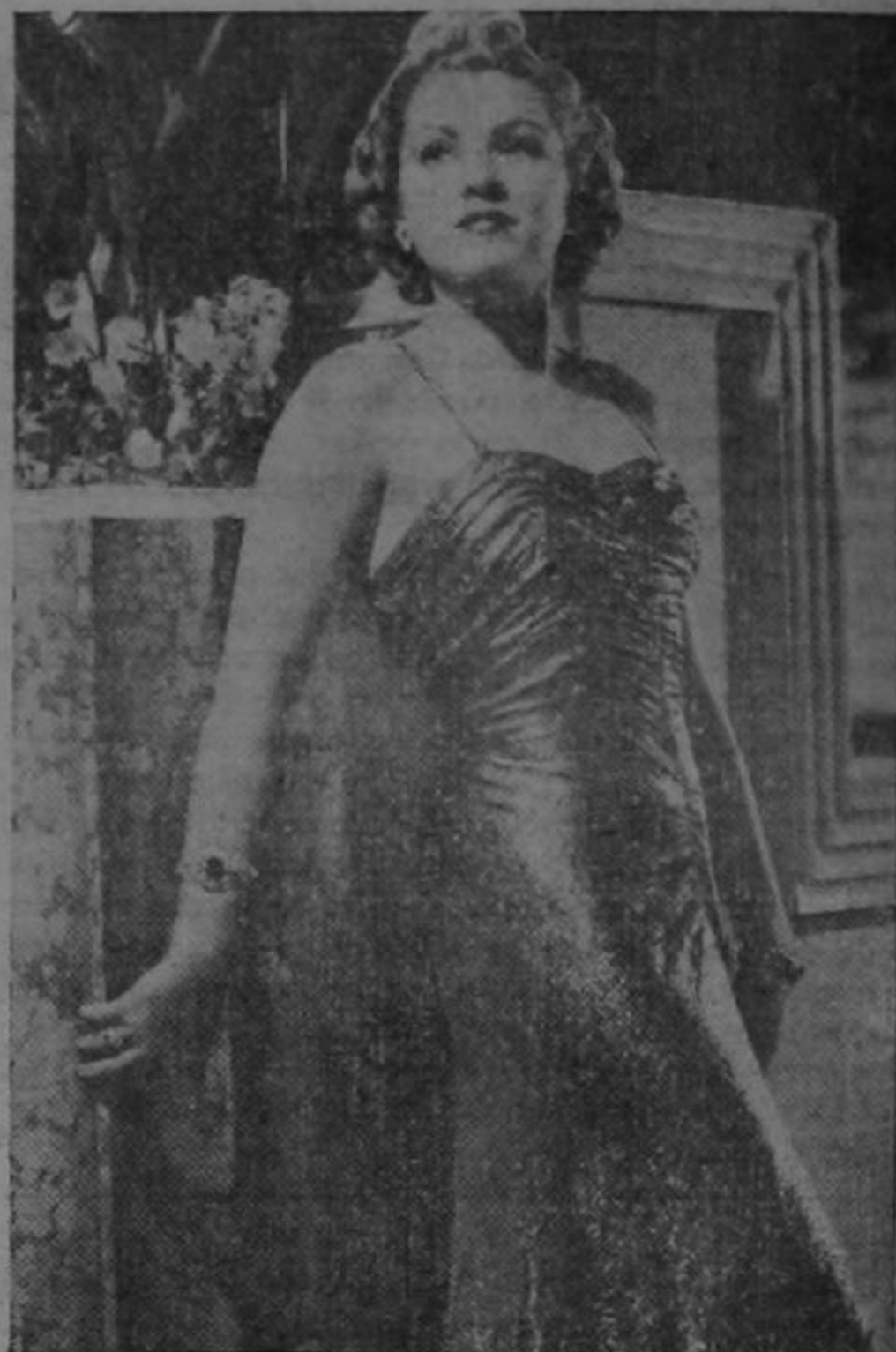
Claire Trevor lleva un traje de noche en lamé de plata que se adapta magistralmente al cuerpo, con fruncidos amplios en el corpiño, y caída de la falda en forma de abanico. (Foto Acme-Editors Pres).